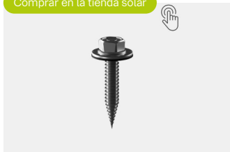
Self Tapping Screws