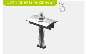
Middle Clamp novotegra