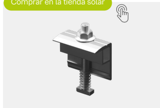
End Clamp novotegra