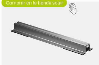
NT Rail novotegra